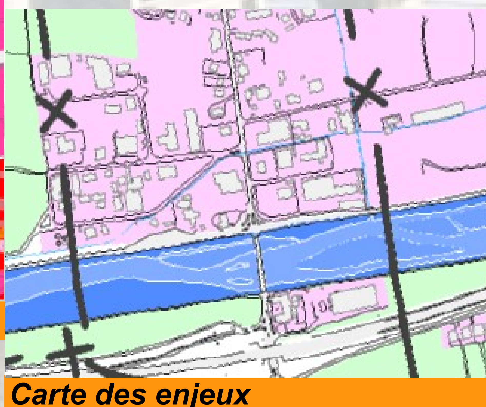
Carte des enjeux