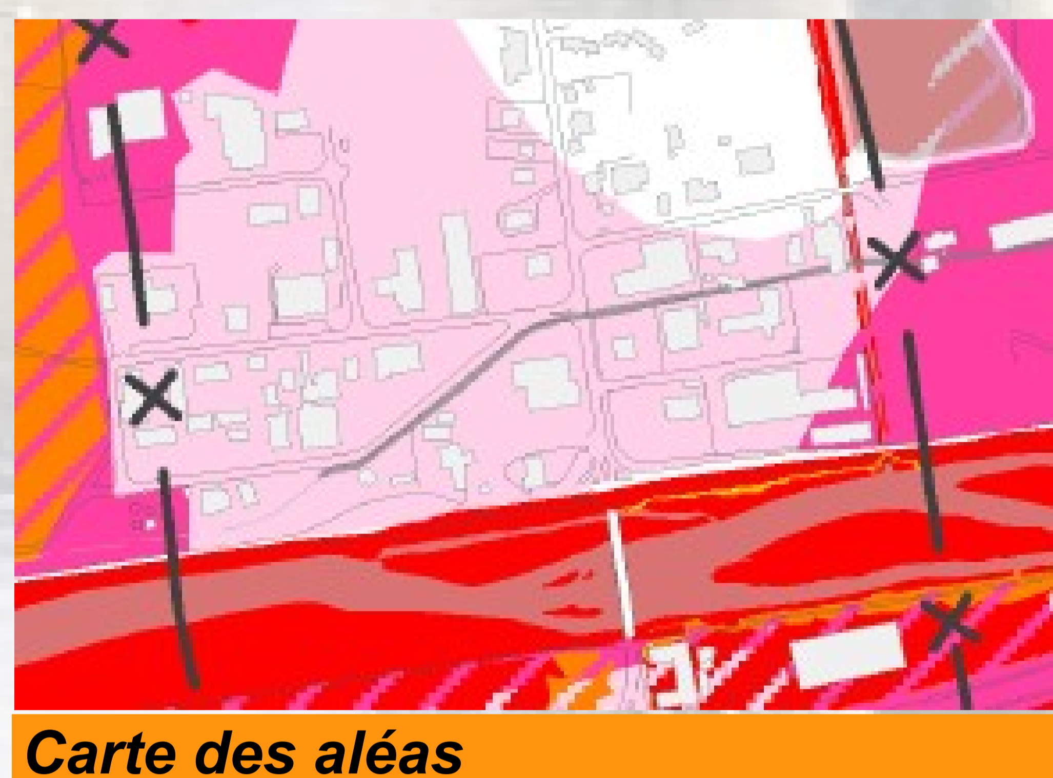
Carte des aléas

est la plus forte crue connue ou la crue calculée d'occurrence centennale si la crue historique est moins importante.