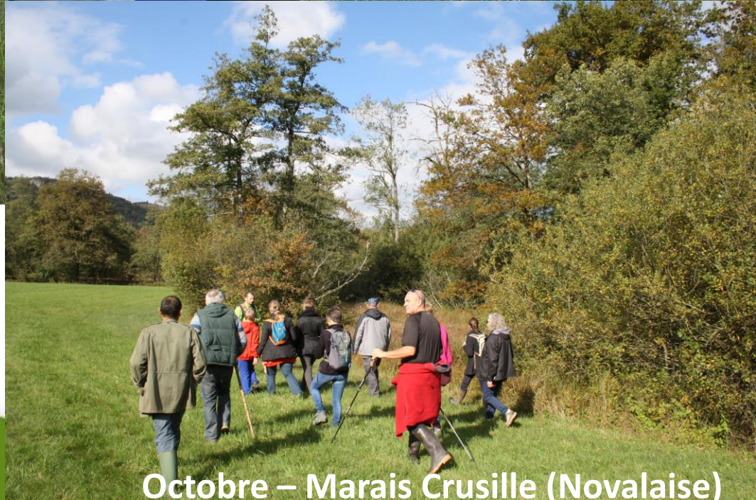
Octobre – Marais Crusille (Novalaise)