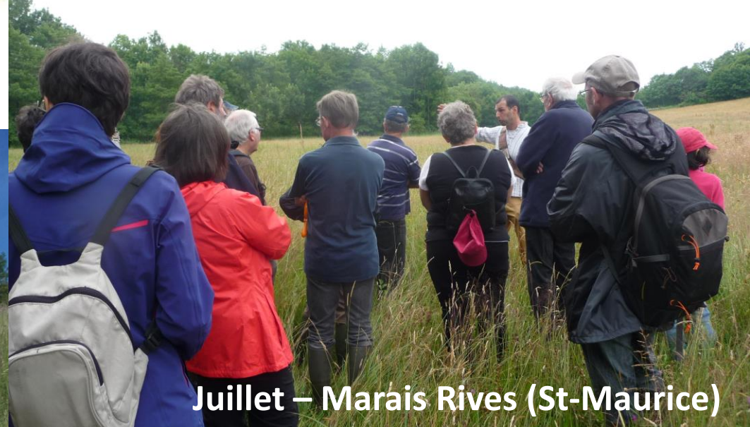
Juillet – Marais Rives (St-Maurice)