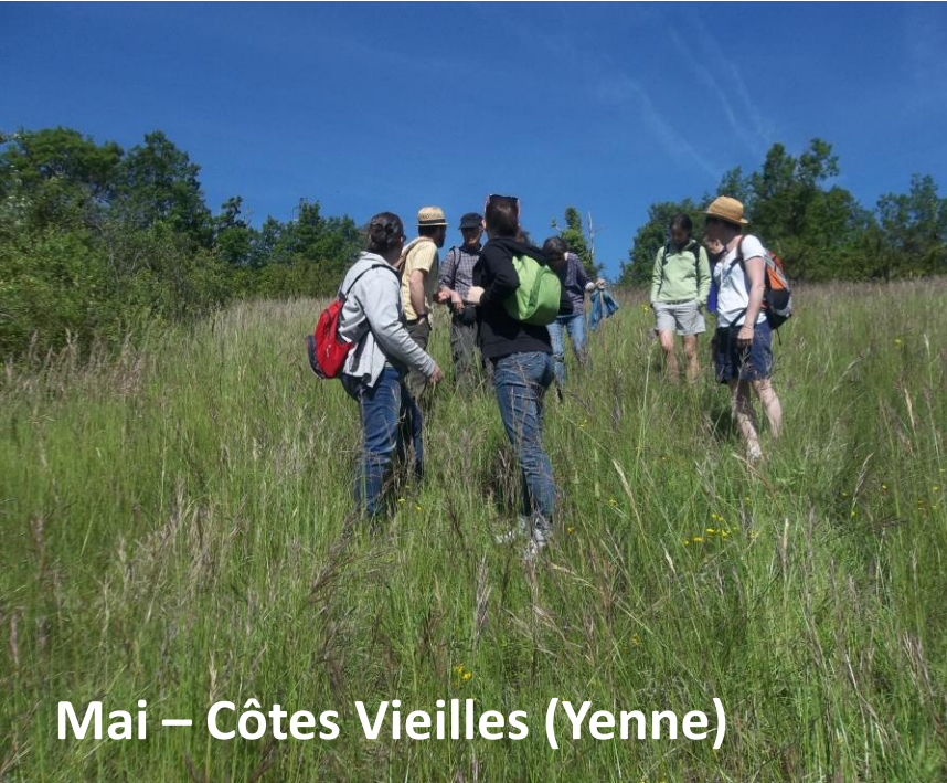
Mai – Côtes Vieilles (Yenne)